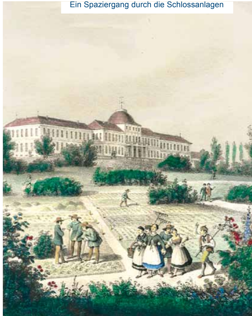
Ein Spaziergang durch die Schlossanlagen